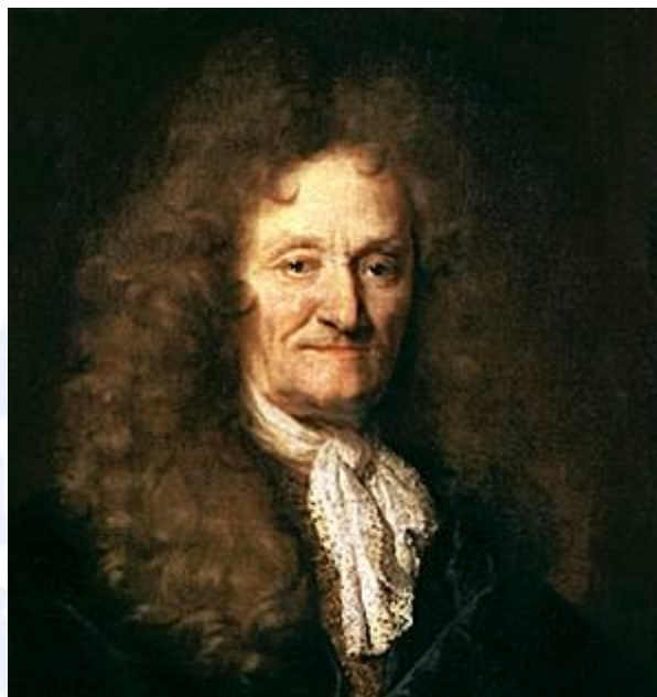
Jean de La Fontaine

Réécoute plusieurs fois l'enregistrement, vérifie tes réponses et corrige éventuellement.